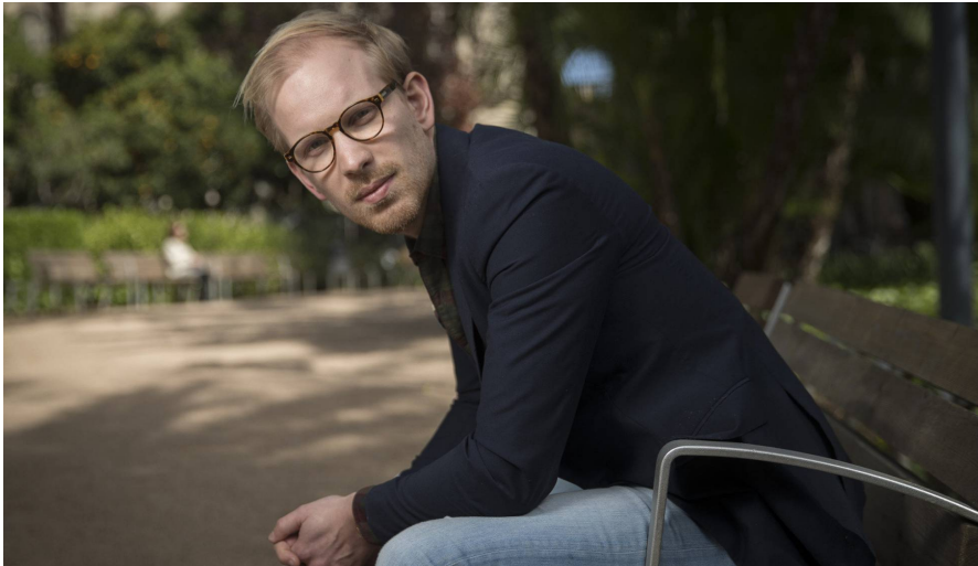
El historiador Rutger Bregman.

El historiador Rutger Bregman (Westerschouwen, Holanda, 1988) irrumpió en el debate ideológico de su país hace ya tres años con la publicación de su ensayo Utopía para realistas . El texto se divulgó primero en Internet, en la web The correspondent . La industria editorial se sumó más tarde al fenómeno, que llega ahora a España de la mano de Salamandra. Colaborador en medios como The Washington Post o The Guardian , Bregman cree viable sacudir el capitalismo con propuestas como la renta básica universal , reducir las jornadas laborales a 15 horas semanales o abrir fronteras para acabar con la desigualdad.